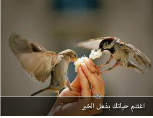
اغتنم حياتك بفعل الخير