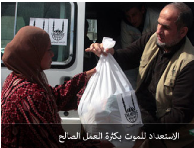
الاستعداد للموت بكثرة العمل الصالح

أولئك الأكياس؛ أن تكثر ذكر الموت، وأن تكثر من الاستعداد له؛ بالتوبة، وبالوصية، وبالعمل الصالح، وبإنفاق المال، وبالذعوة إلى الله، وبالنهى عن المنكر، والأمر