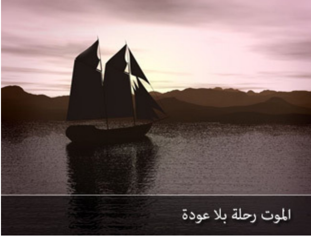
الموت رحلة بلا عودة

والموت مشكلته: لا يذكر في كثير إلا قلبه. أكبر حجم مالي تخسره في ثانية واحدة، توقف القلب؛ ماذا تملك من أموال منقولة أو غير منقولة صارت لغيرك، قدمت لك هدايا ثمينة في حياتك، لك مركبة تعتني بها، لا يركبها أحد سواك، تؤخذ مفاتيحها، وكانت لا يستعملها أحد من أولادك، جاء الموت فانتهى الأمر، ولم تعد تملك شيئاً، والكفن ليس له جيوب، بضعة أمتار من الخام الأبيض، في حين كانت بدلته ثمنها ثمانون ألفاً، والآن يلفوه بخام ثمنه عشرون ليرة، هذا هو الموت، الموت خطير جداً، مغادرة بلا عودة.