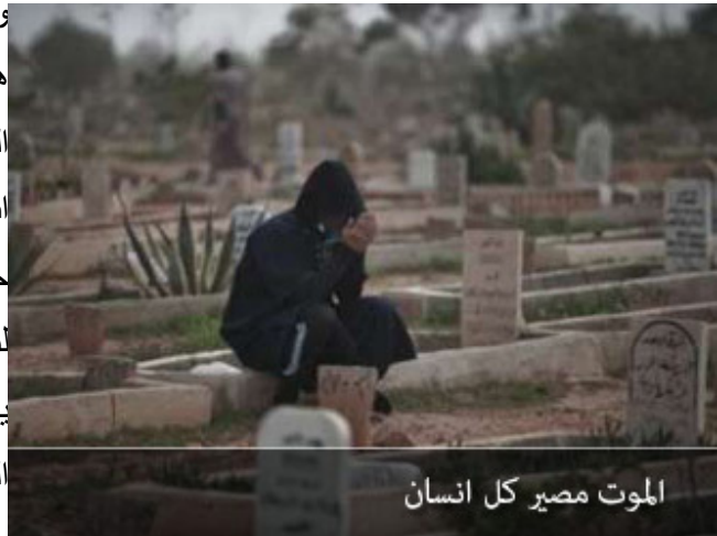
الموت مصير كل إنسان

يقول شاب: أنا في أول حياتي بعيد عني شبح الموت.