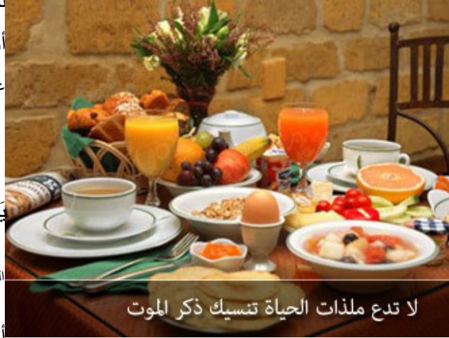
لا تدع ملذات الحياة تنسيك ذكر الموت

أكثرُوا: ليس الأمر منصباً على هازم اللذات،