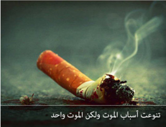
تنوعت أسباب الموت ولكن الموت واحد

قالت له: أخاف أن أموت من هذا الطبيب، فقال لها: طبعاً ستموتين وأنا سأموت. رجل سأل طبيبياً: نسبة نجاح العملية كم؟ قال له: بالمائة ثمانون، قال له: كيف؟ قال: إذا أجرى العملية عشرة أشخاص فيموت اثنان، فقال: لا أريد، لأنني أريد بالمائة مائة، فقال: لو كانت النتائج بالمائة مائة لما مات أحد. أحياناً لأتفه سبب: عملية لوزات يموت منها الإنسان، إنسان بمنصب رفيع جداً، كل